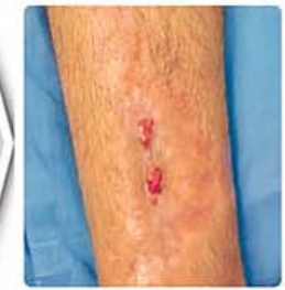
چهار هفته بعد