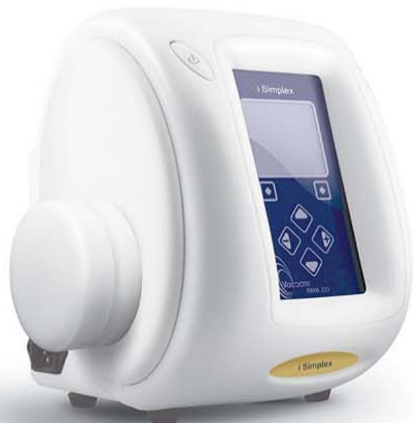
Simplex III ■