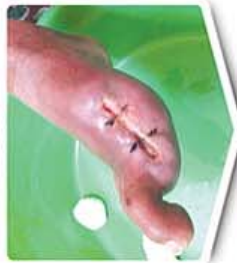
چهار هفته بعد