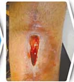
سه هفته بعد