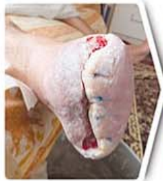
سه هفته بعد