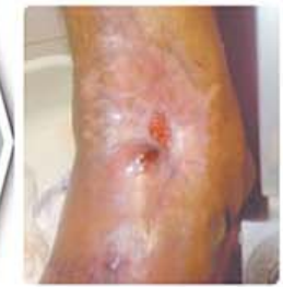
هشت هفته بعد