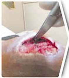
یک هفته بعد