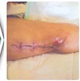
هشتاد و یک روز بعد