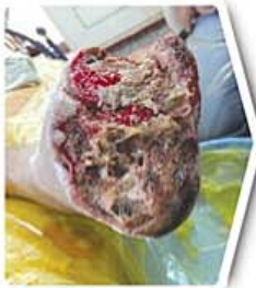
Diabetic Foot Ulcer