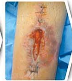
دو هفته بعد