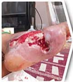
سه هفته بعد