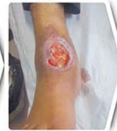
دو هفته بعد