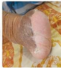
هشت هفته بعد