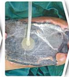
حین وکیوم تراپی