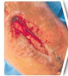
Postoperative Infection ( tibia fracture )