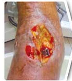
Postoperative Infection with Necrosis