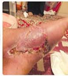
دو ماه بعد