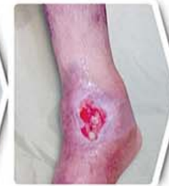
سه هفته بعد