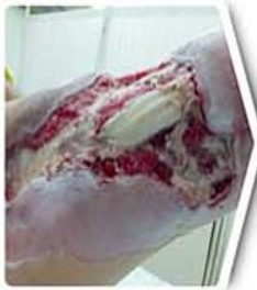
Diabetic Foot Ulcer