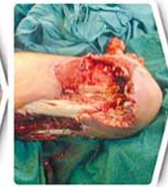
سه هفته بعد