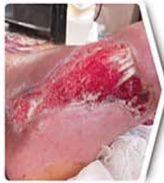
پنج هفته بعد