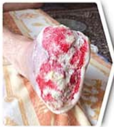
دو هفته بعد