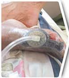
Diabetic Foot Ulcer