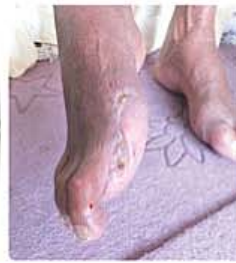
هشت هفته بعد