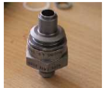
QUICK DISCONNECT COUPLING