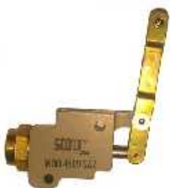
VALVE PARK BRAKE & CYLINDER MASTER BRAKE