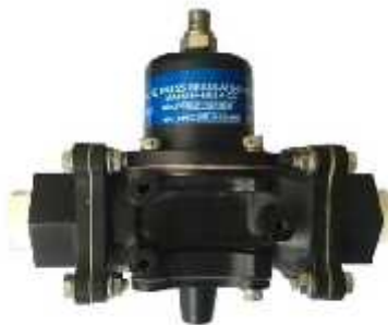
REGULATOR RELIEF VALVE