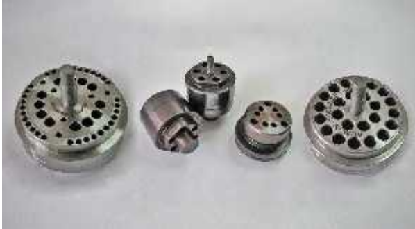
DELTA COMPRESSORS VALVE