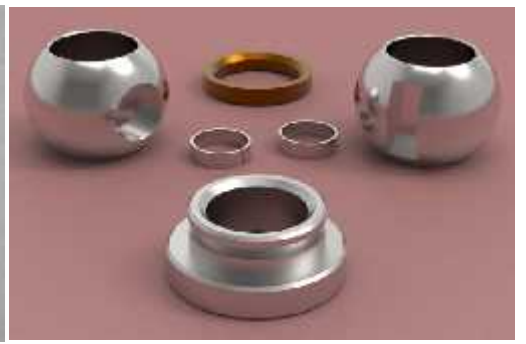
SEAT & BALL