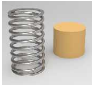
SPRING & BUTTON