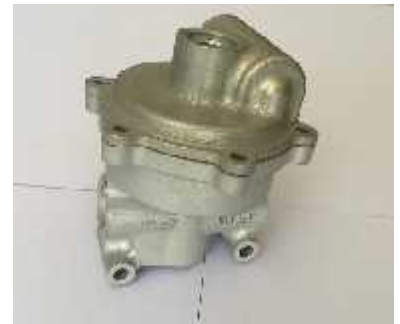
AIR PRESSURE REGULATOR